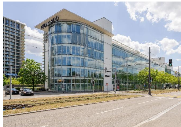
Links: Zürich, Birmensdorferstrasse/Aemtierstrasse/Kalbreitestrasse; rechts: Zürich, Thurgauerstrasse/Schärenmoosstrasse

Swissinvest konnte rückwirkend per 1. Dezember 2025 bzw. 15. Dezember 2025 zwei substanzielle Akquisitionen an hervorragenden Lagen in der Stadt Zürich mit einem Anlagevolumen von rund CHF 210 Mio. abschliessen. Dadurch steigt die Fremdfinanzierungsquote per Halbjahresabschluss 2025 auf voraussichtlich 31%. Der Erlös der geplanten Kapitalerhöhung im Umfang von CHF 150 bis 200 Mio. im ersten Quartal 2026 wird für die Rückführung von Fremdkapital sowie den weiteren Ausbau des Portfolios verwendet. Die Details zur Kapitalerhöhung werden zu einem späteren Zeitpunkt bekanntgegeben.