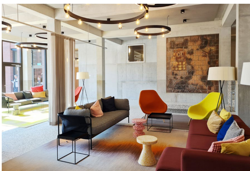
Blick von der Dachterrasse Richtung Pilatus; Lobby, Ziegeleiweg 1