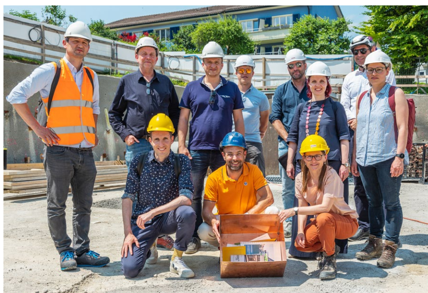
Grundsteinlegung Anton-Higi-Strasse

Die in hybridbauweise zu erstellende Wohnliegenschaft weist rund 2150 m 2 Hauptnutzfläche auf (Mehrfläche + 74 Prozent gegenüber Bestand). Die