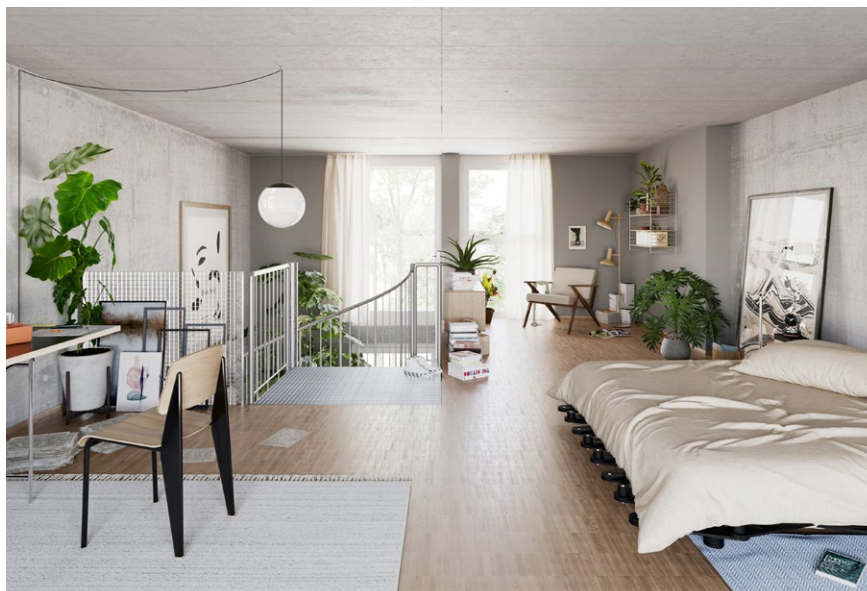
Visualisierung Maisonette-Loft

Pensimo und Adimora verschiedene Wohnbauten, darunter zwei 75 Meter hohe Hochhäuser und ein Gewerbehaus. Im Oktober 2022 wurde mit dem Bau der ersten Etappe gestartet. Der sogenannte Längsbau, der für die Anlage Adimora realisiert wird, wird das erste bezugsbereite Wohngebäude sein. Die 31 Maisonette-Lofts werden im 2. Quartal 2024 an die ersten Bewohnerinnen und Bewohner des Zwhatt-Areals übergeben.