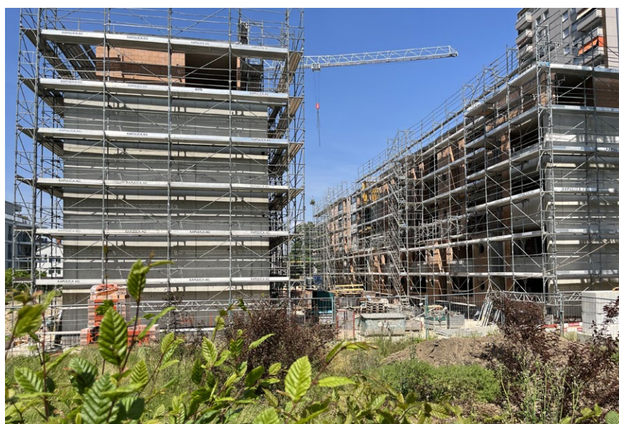
Gempenstrasse 1/3 in Birsfelden